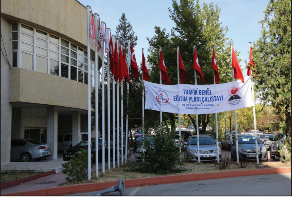
25-26 Eylül 2017 tarihleri arasında gerçekleştirilen Trafik Genel Eğitim Planı Çalıştayı