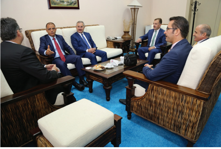
25-26 Eylül 2017 tarihleri arasında gerçekleştirilen Trafik Genel Eğitim Planı Çalıştayı'ndan görüntüler