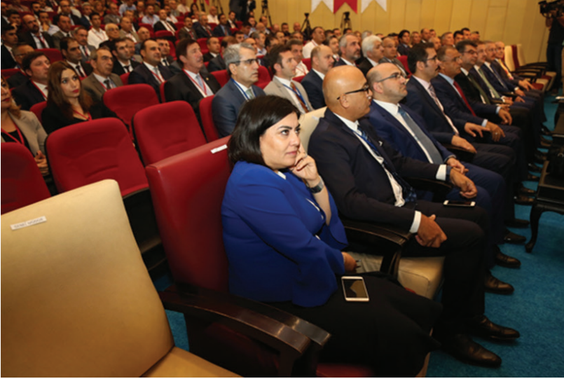
25-26 Eylül 2017 tarihleri arasında gerçekleştirilen Trafik Genel Eğitim Planı Çalıştayı'ndan görüntüler