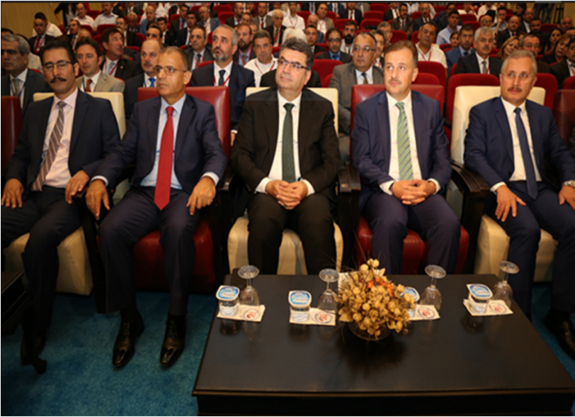
25-26 Eylül 2017 tarihleri arasında gerçekleştirilen Trafik Genel Eğitim Planı Çalıştayı'ndan görüntüler