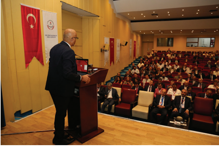
25-26 Eylül 2017 tarihleri arasında gerçekleştirilen Trafik Genel Eğitim Planı Çalıştayı genel sunumdan görüntüler