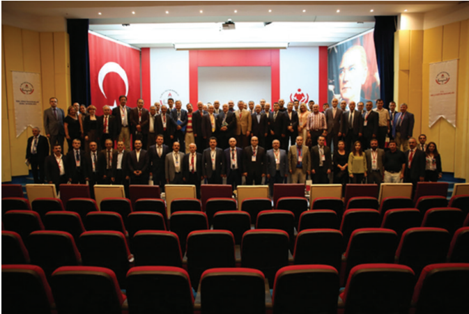
25-26 Eylül 2017 tarihleri arasında gerçekleştirilen Trafik Genel Eğitim Planı Çalıştayı'ndan görüntüler