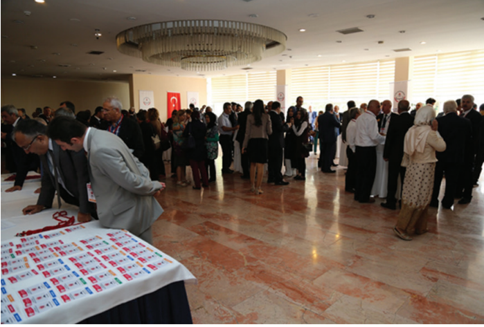
25-26 Eylül 2017 tarihleri arasında gerçekleştirilen Trafik Genel Eğitim Planı Çalıştayı'ndan görüntüler