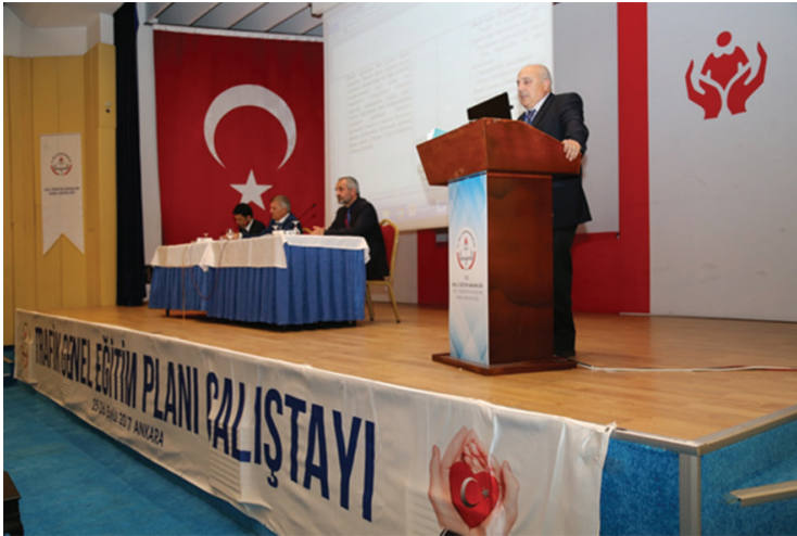
25-26 Eylül 2017 tarihleri arasında gerçekleştirilen Trafik Genel Eğitim Planı Çalıştayı sonuç bildirgesinden görüntüler