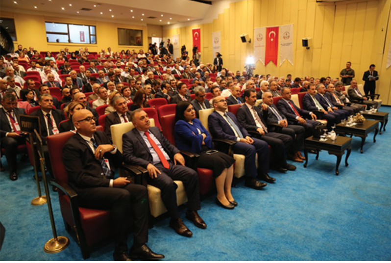
25-26 Eylül 2017 tarihleri arasında gerçekleştirilen Trafik Genel Eğitim Planı Çalıştayı'ndan görüntüler