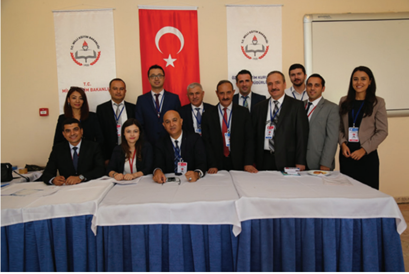
25-26 Eylül 2017 tarihleri arasında gerçekleştirilen Trafik Genel Eğitim Planı Çalıştayı'ndan görüntüler