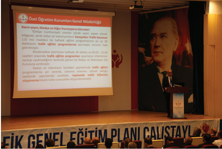
25-26 Eylül 2017 tarihleri arasında gerçekleştirilen Trafik Genel Eğitim Planı Çalıştayı genel sunumdan görüntüler