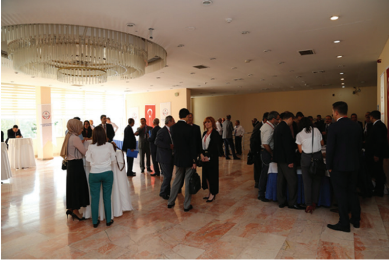
25-26 Eylül 2017 tarihleri arasında gerçekleştirilen Trafik Genel Eğitim Planı Çalıştayı'ndan görüntüler