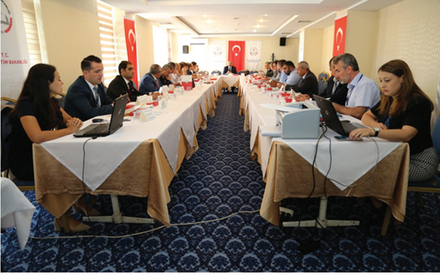
25-26 Eylül 2017 tarihleri arasında gerçekleştirilen Trafik Genel Eğitim Planı Çalıştayı çalışma salonlarından görüntüler