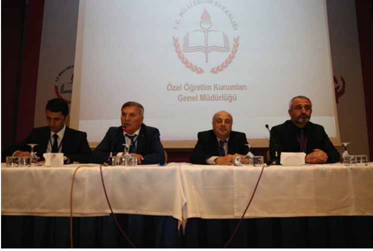
25-26 Eylül 2017 tarihleri arasında gerçekleştirilen Trafik Genel Eğitim Planı Çalıştayı sonuç bildirgesinden görüntüler