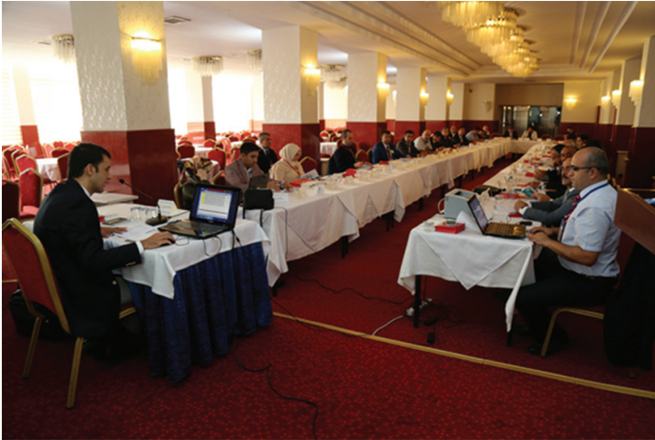
25-26 Eylül 2017 tarihleri arasında gerçekleştirilen Trafik Genel Eğitim Planı Çalıştayı çalışma salonlarından görüntüler