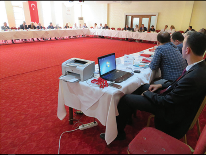
25-26 Eylül 2017 tarihleri arasında gerçekleştirilen Trafik Genel Eğitim Planı Çalıştayı çalışma salonlarından görüntüler