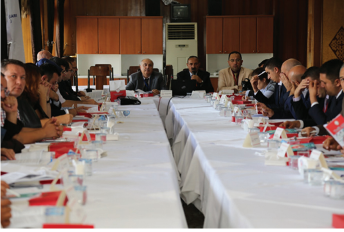
25-26 Eylül 2017 tarihleri arasında gerçekleştirilen Trafik Genel Eğitim Planı Çalıştayı çalışma salonlarından görüntüler