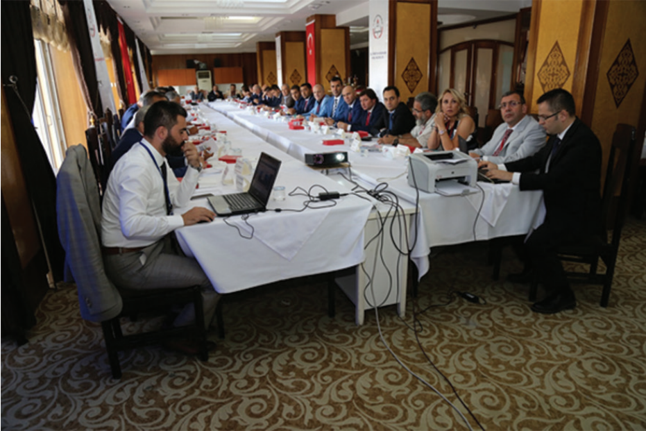
25-26 Eylül 2017 tarihleri arasında gerçekleştirilen Trafik Genel Eğitim Planı Çalıştayı çalışma salonlarından görüntüler