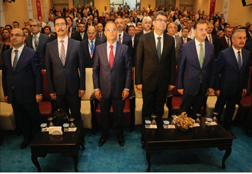
25-26 Eylül 2017 tarihleri arasında gerçekleştirilen Trafik Genel Eğitim Planı Çalıştayı'ndan görüntüler